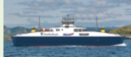
Ny 50-bilers Smølaferge med utsiktsalong fra 2012.