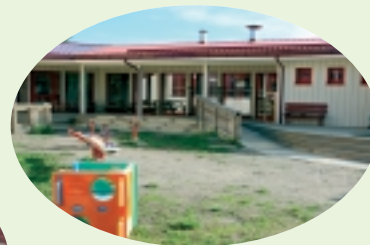
Nye Nordsmøla barnehage