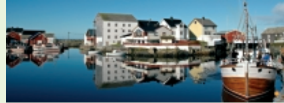
Havna på Veiholmen

Venstre vil være garantisten for fortsatt framtidsretta næringsatsing på Smøla!