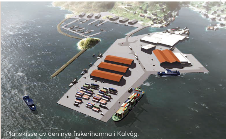
Planskisse av den nye fiskerihamna i Kalvåg.