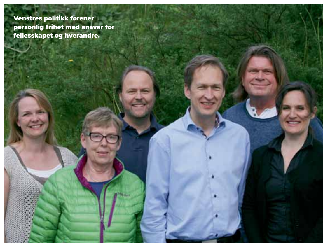
Venstres politikk forener personlig frihet med ansvar for fellesskapet og hverandre.

Venstre er et liberalt parti, og vårt grunnsyn er sosialliberalismen. Vår politikk forener personlig frihet med ansvar for fellesskapet og hverandre. Liberal politikk tar utgangspunkt i det enkelte mennesket, og vi er utålmodige etter rettferdige løsninger som gir alle mennesker frihet. Alle skal ha mulighet til å bruke sine evner til beste for seg selv og samfunnet.