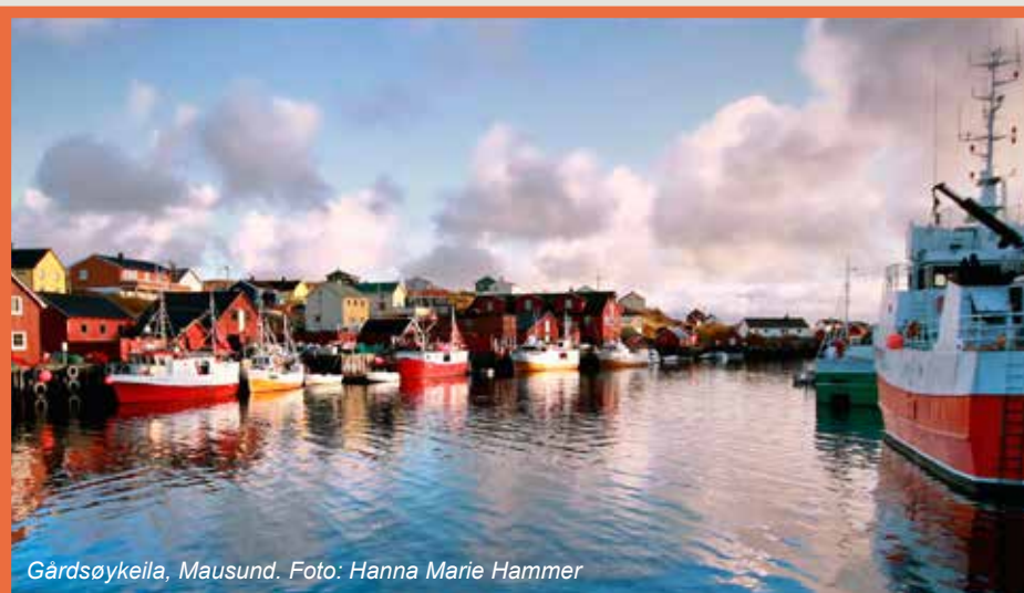
Gårdsøykeila, Mausund.

Integreringsarbeidet er noe vi må lykkes med.