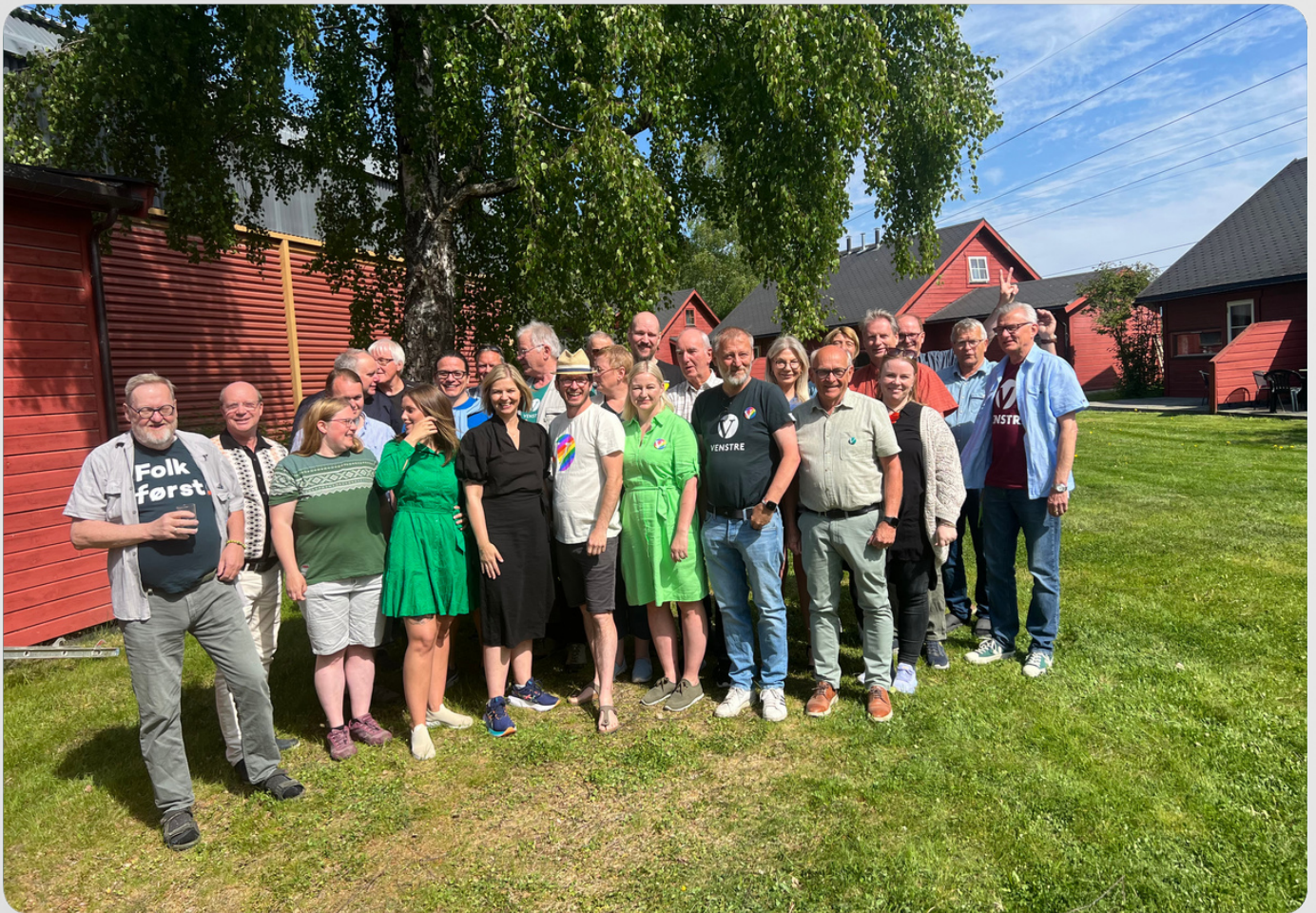
Valgkamsamling juni 2023, Jorekstad