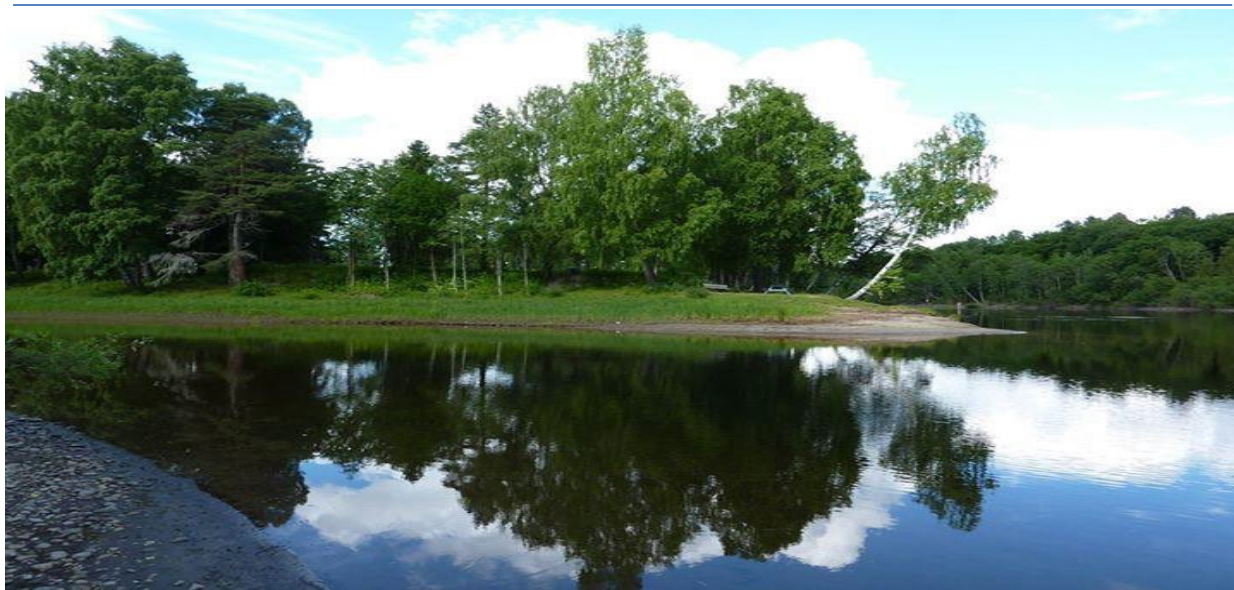
Petersøya fra brakkområde til naturperle i byens sentrum

Venstres sosialliberale politikk tar utgangspunkt i det enkelte menneske. Venstre tror på frihet til å skape innenfor sosialt ansvarlige rammer. Stat og kommune er til for individets skyld, ikke omvendt, FOLK FØRST! Venstre har tro på et samfunn der personlig initiativ og skaperevne får utvikle seg, der individets rett til å kunne realisere sine mål er til stede, samtidig er det like viktig å vise sosialt ansvar, bry seg om, og kunne samarbeide med andre.