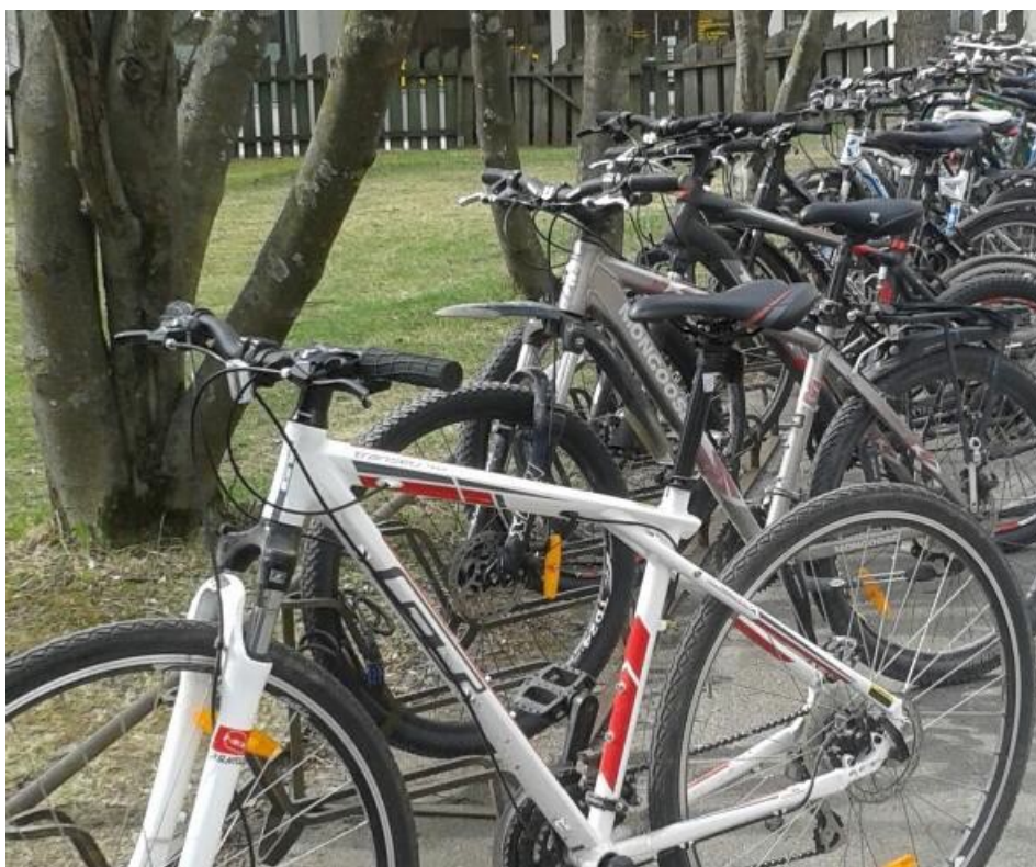
Muligheter for bysykler