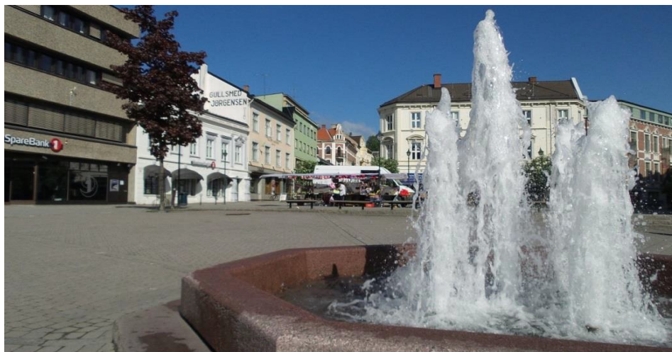
Vakkert Søndre Torv, skjemmende plassering av salgsbod mot Stabels gate?