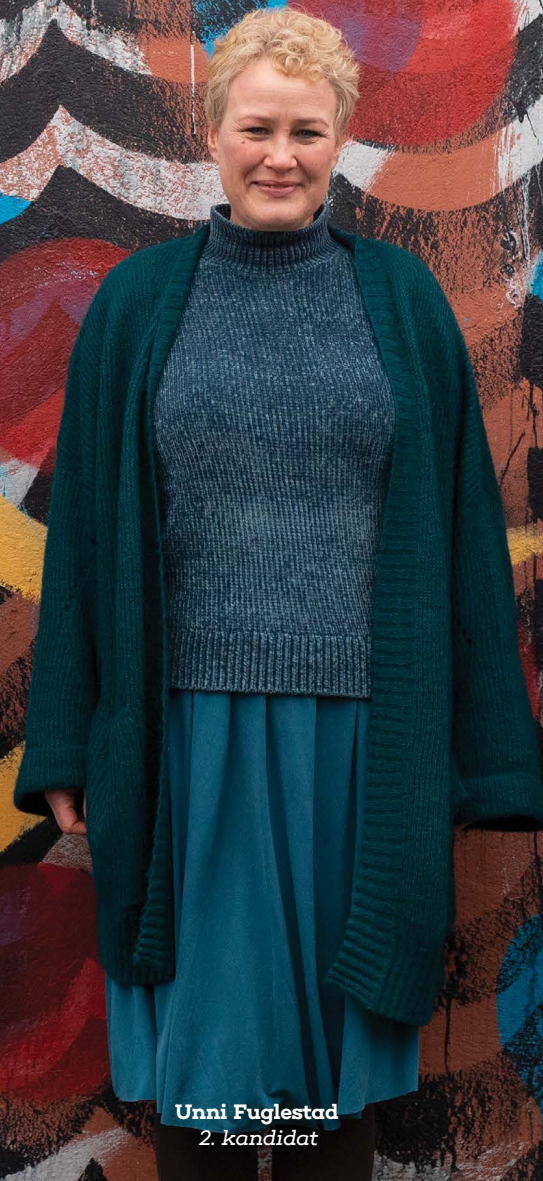
Unni Fuglestad 2. kandidat