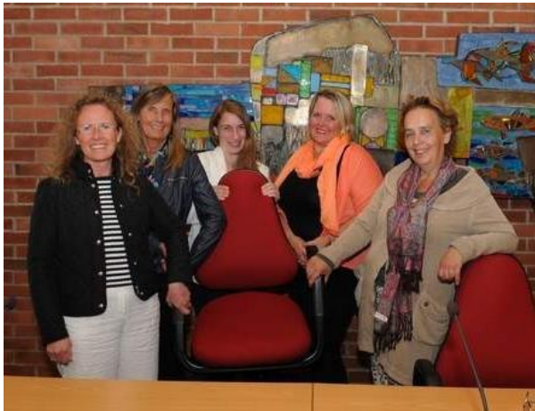
De fem kvinnelige ordfører kandidatene i Nes ved kommunestyrevalget 2015