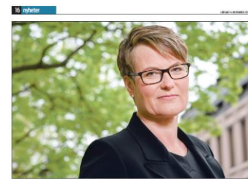
Ministeren svarer Venstre i torvuttaksaken

Nes Venstre mener tiltaket krever søknad etter Plan- og bygningsloven og at tiltaket generelt er i strid med kommunens politisk vedtatte klima- og energiplan. Partiet har i flere omganger reist interpellasjoner i saken og engasjert seg i media. Dette har foregått i nært samarbeid med Ullensaker Venstre og Ola Elvestuen på Stortinget.