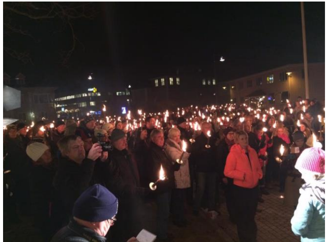
Over 1200 Nesbuer markerer sitt ønske om å beholde Nes lensmannskontor.