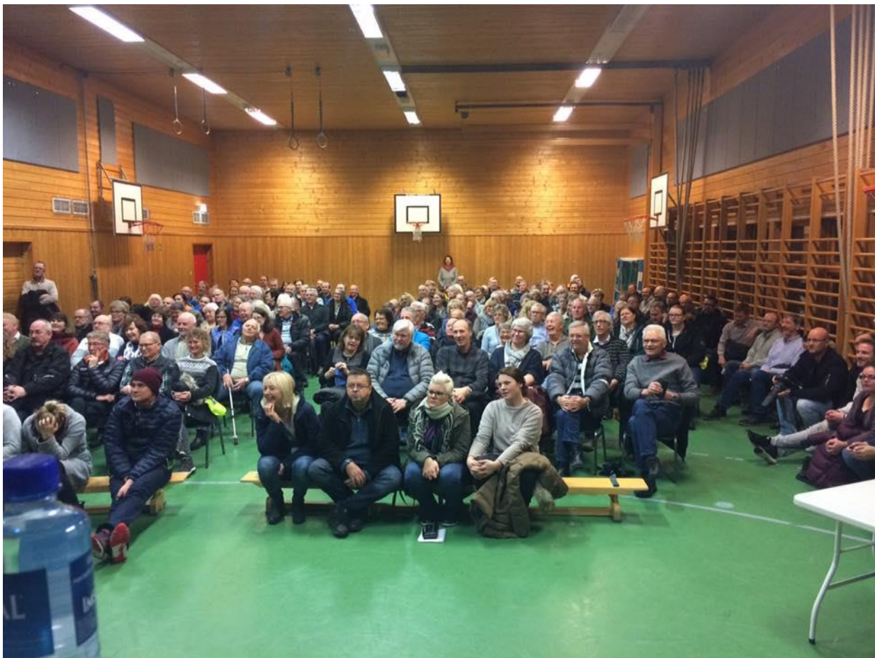
Figur 1- Bilde fra folkemøtet på Auli.