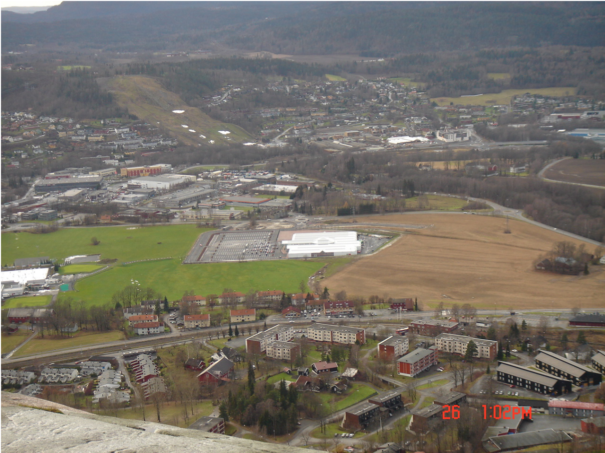
Plantasjen med tilhørende parkeringsplass på Løken gård – Foto: Ole A. Lilloe-Olsen 2007

Noen kjenner prisen på alt, men ikke verdien av noe! Oscar Wilde