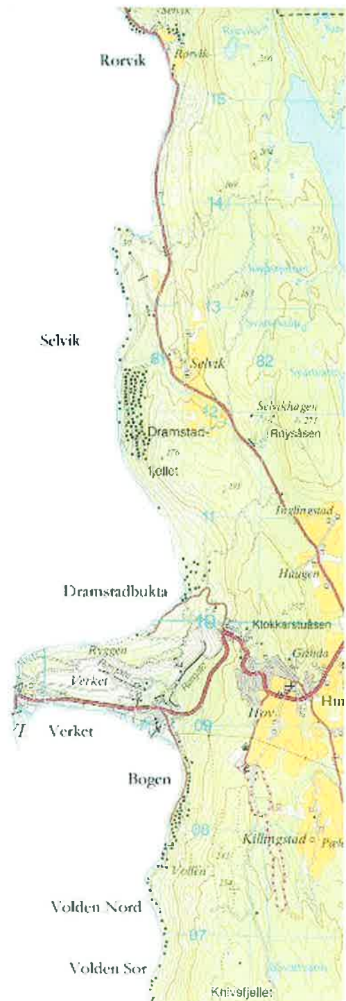
Kartutsnitt, Volden, Verket, Dramstad og Rørvik

På strekningen Bogen til og med Verket, på sørsiden av Ryggen, ligger det boligeiendommer, enkelte fritidseiendommer og friområder langs sjøen. Ytterst på Verket, rett sørover fra fergeleie ligger Verketsøya. Øya er adskilt fra fastlandet med en smal kanal og er i det alt vesentlige avsatt til friområde. Øya er forøvrig i Svelvik kommunes eie.