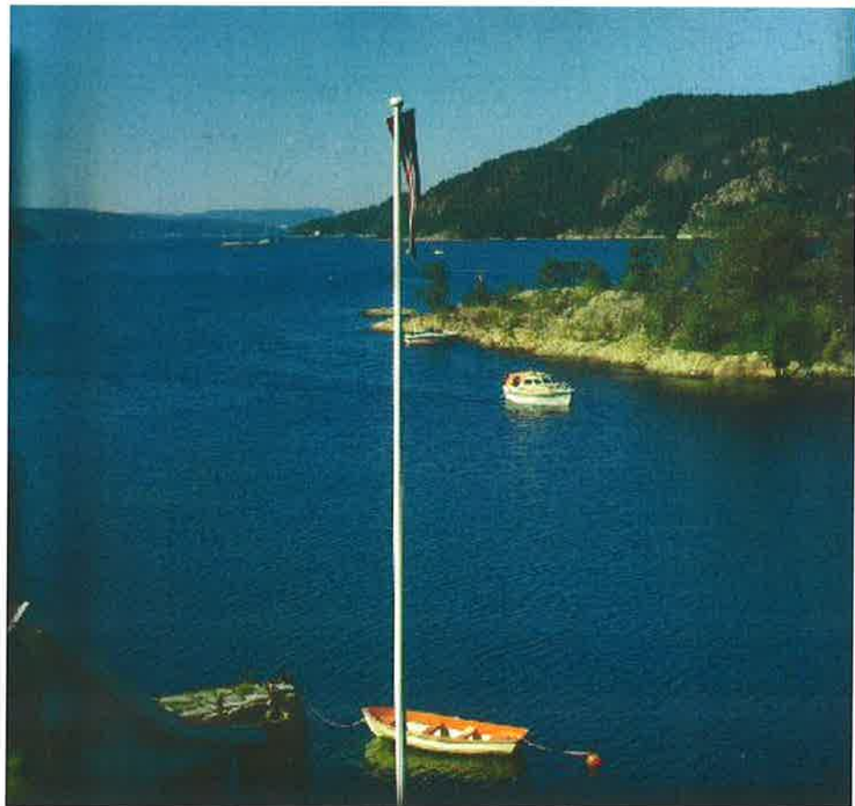
Bilde: illustrasjonsbilde.