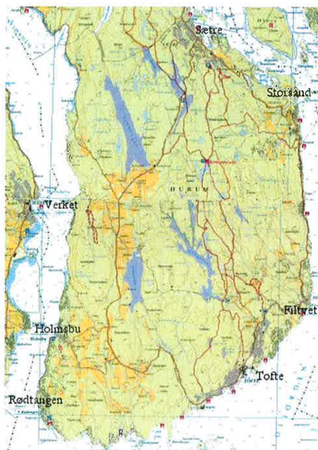
Fig. 1. Oversiktskart Røyken og Hurum kommuner