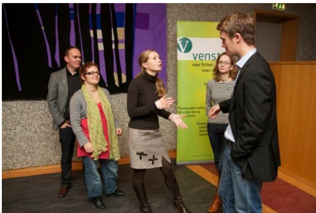
Ved valget i 2011 fikk Venstre en oppslutning på 7 % i Bergen.