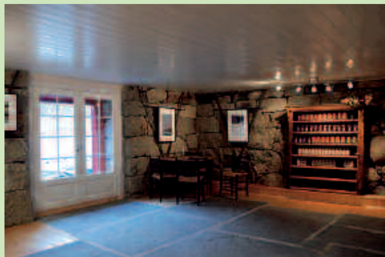
Lutro Gard er eit godt døme på nyetablerte små verksemder som driv med foredling av lokalprodusert mat.

Det skal verta betre vilkår for lokalproduksjon av øl og cider.