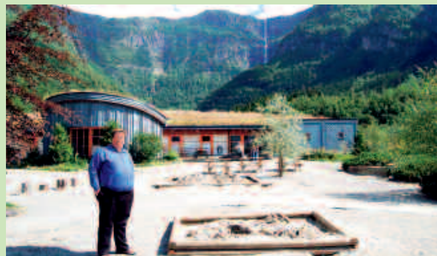
Veisane barnehage er eit godt døme på korleis barnehagane må vera.

Barnehagane må eventuelt utvidast slik at alle får plass nærast der dei bur.