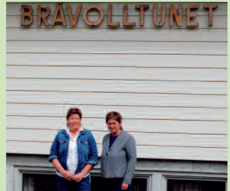
Bråvolltunet treng utvidast med rehabiliteringsplassar og personell.

Venstre skal syta for at tannhelsetenesta skal verta offentleg.