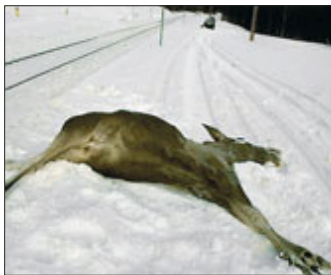
NSB må slutte å kjøre på dyr!