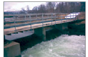
Elva flommer over sine bredder rett som de er.