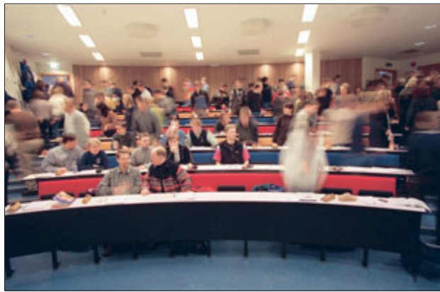
Høgskolen i Bodø bør bli en del av en større utdanningsregion: region nord.

UiNN vil bestå av mange fakultet som igjen består av de gamle høyskolene og fakultetene ved næværende universitet (UiT). Hvert fakultet skal tilby en bred praktisk 3-årig bachelorutdanning og videre ved noen fakultet kunne tilby en 2-årig teoretisk (spesialisert) masterutdanning. I det framtidige