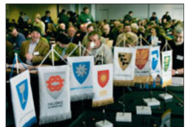
Venstre utfordrer den enkelte kommune i Nordland i klimapolitikken.