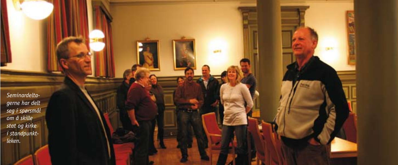
Seminar deltagerne har delt seg i spørsmål om å skille stat og kirke i standpunkt-leken.