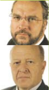
Lars Sponheim Venstres leder