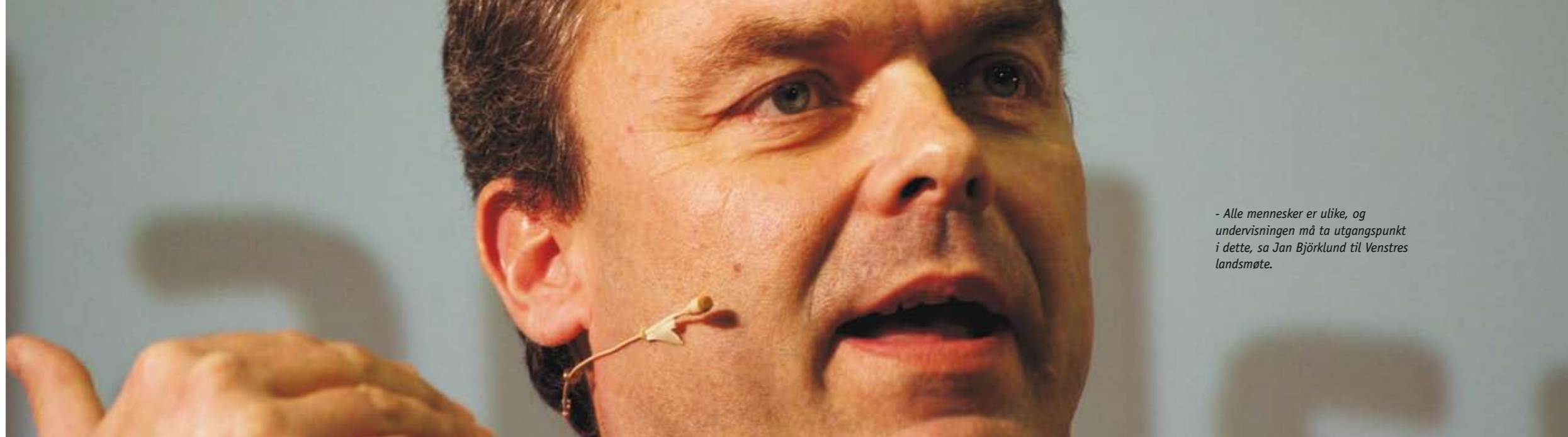
- Alle mennesker er ulike, og undervisningen må ta utgangspunkt i dette, sa Jan Björklund til Venstres landsmøte.