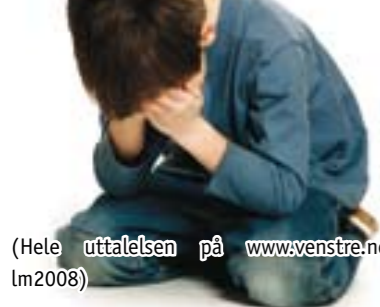
(Hele uttalelsen på www.venstre.no/lm2008 )