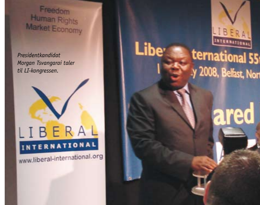
Presidentkandidat Morgan Tsvangirai taler til LI-kongressen.

Også spørsmålet om adopsjon vekket debatt. – Det er ingen som har rett til å få barn. Selvfølgelig ikke. Men når det gjelder adopsjon har folk rett til å bli vurdert. I dag kan homofile og lesbiske være både besøkshjem og fosterhjem, og det vil være ganske dumt hvis de ikke også har muligheten til å bli vurdert i forbindelse med adopsjon, når det er en riktig og god løsning for barnet, påpeker Trine Skei Grande.