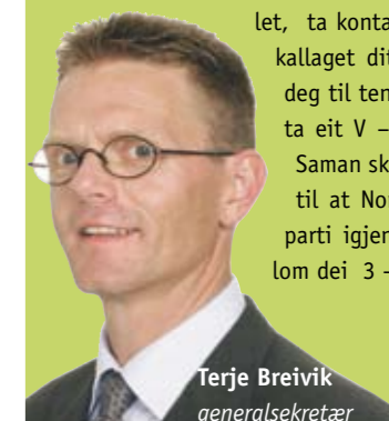
Terje Breivik generalsekretær

Om du er usikker på korleis du kan bidra for at Venstre når 10% - målet, ta kontakt med lokallaget ditt og meld deg til teneste, eller ta eit V – skulekurs. Saman skal me bidra til at Noregs eldste parti igjen vert mellom dei 3 – 4 største!