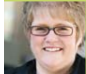
Trine Skei Grande nestleder

Det er behov å ta debatten et steg videre og komme frem til løsninger som er akseptable for alle parter.