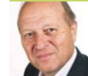
Odd Einar Dørum stortingsrepresentant

Fra min første dag i politikken og til min siste dag i livet kommer jeg til å tro at kunnskap er makt. Jeg kommer alltid til å tro at uten å gi kunnskap til mennesker, vil demokratiet forvitre, og vi vil ikke kunne skape det næringslivet som ennå ikke er født. Derfor er det så ufattelig for meg at vi har en rød-grønn regjering som ikke klarer – innenfor mengden av penger som står til rådighet – å tette det som er et hull i finansieringen av høyere utdanningsinstitusjoner, hvor det fortsatt mangler 300–400 mill. kr. Og det er utfattelig for meg at man ikke klarer å ta forskningen med seg. Det er en glede for meg – på tampen av min tid på Stortinget – å vite at det var en samlet komité som stoppet noen setninger som ville bety at man ville begynne å målstyre grunnforskningen. Hadde man målstyrt grunnforskningen, ville vi aldri ha hatt Darwin, vi ville ikke hatt Newton, og vi ville antagelig ikke hatt noen som helst som kunne ha tenkt noen tanker man ikke kunne måle i øyeblikket.