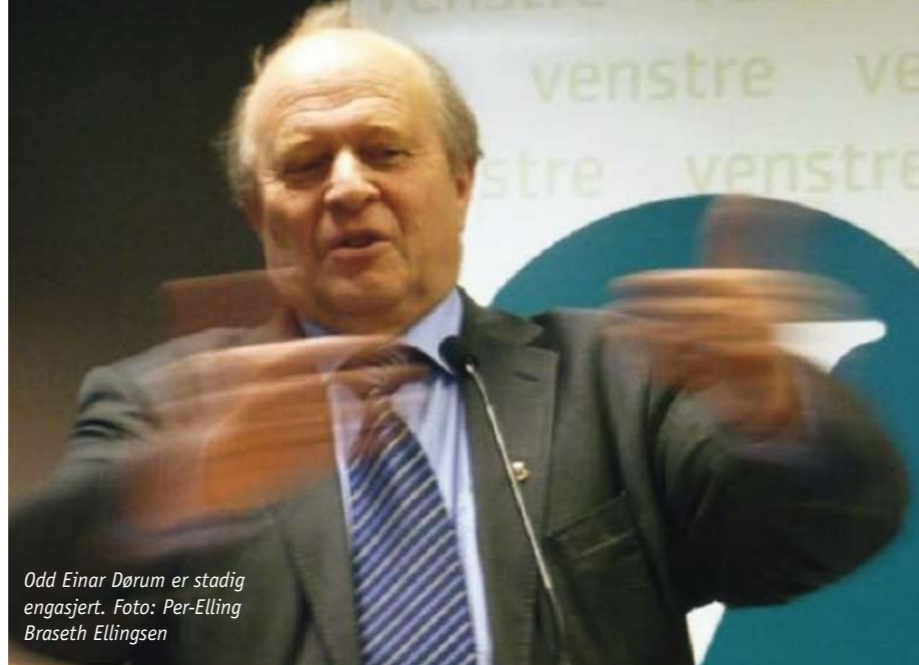
Odd Einar Dørum er stadig engasjert.