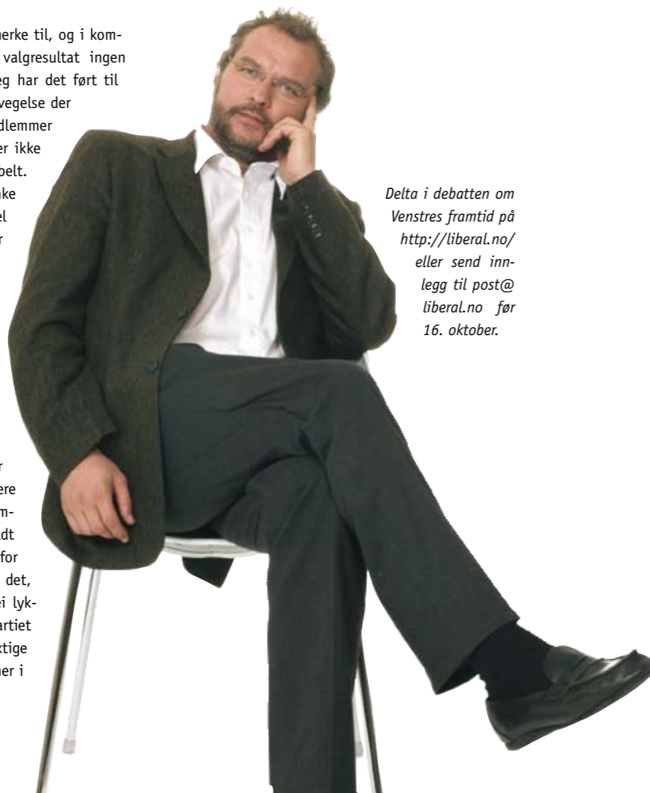
Delta i debatten om Venstres framtid på http://liberal.no/ eller send innlegg til post@liberal.no før 16. oktober.