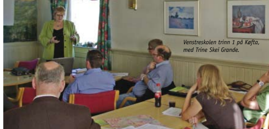
Venstreskolen trinn 1 på Kjøfta, med Trine Skei Grande.