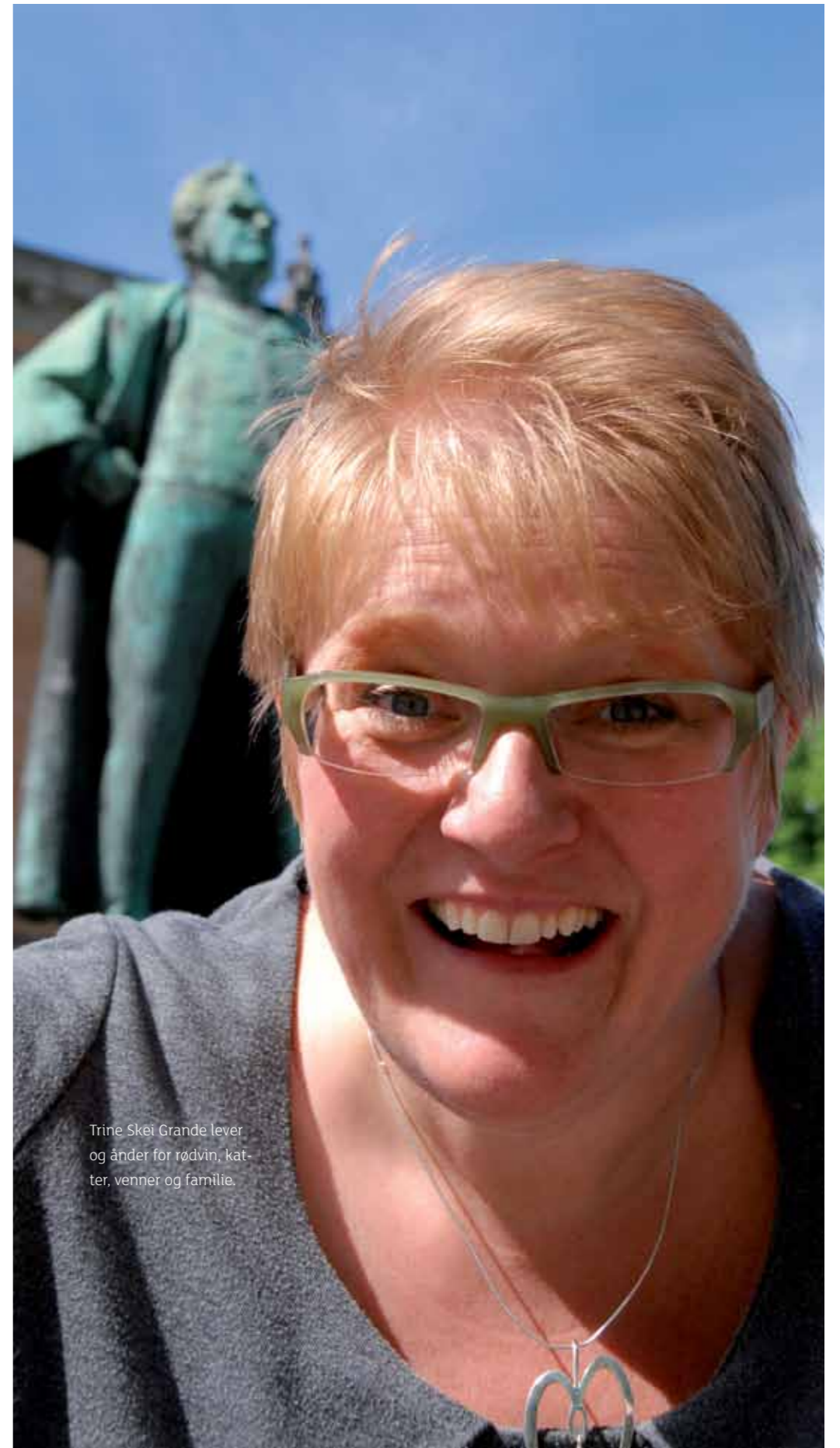
Trine Skei Grande lever og ånder for rødvin, katter, venner og familie.