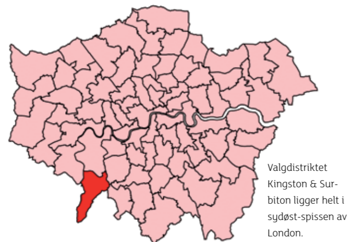
Valgdistriktet Kingston & Surbiton ligger helt i sydøst-spissen av London.