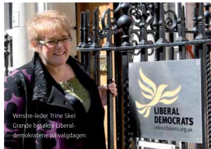
Venstre-leder Trine Skei Grande besøkte Liberaldemokratene på valgdagen.