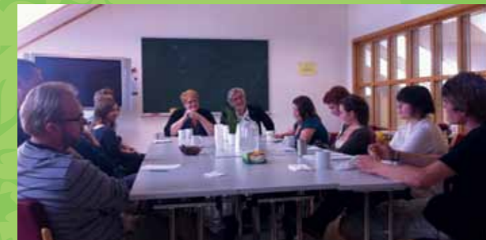
... og i møte med NTNU-studenter i Trondheim.