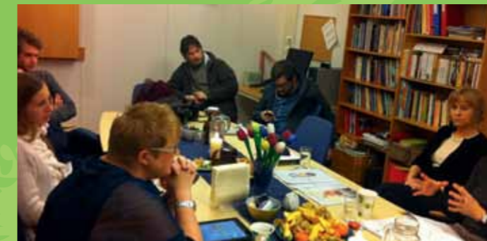
... på en helsestasjon i Bergen...