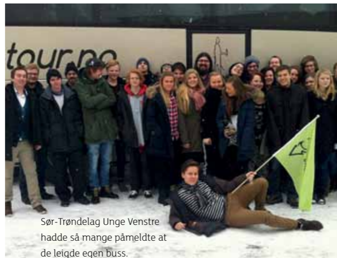
Sør-Trøndelag Unge Venstre hadde så mange påmeldte at de leigde egen buss.