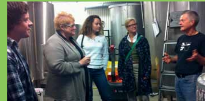
På Haandbryggeriet i Drammen...

Har du tenkt at det hadde vært topp om partilederen kom på besøk til nettopp dere en dag? Eller har dere en sak dere mener at de burde blitt bedre kjent med? Finnes det spennende bedrifter, institusjoner eller foreninger hos deg som det hadde vært midt i blinken å vise frem?