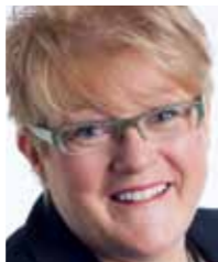
Trine Skei Grande

Når velgerne blir spurt om hva som er de viktigste politiske sakene i et valg, kommer skole ofte helt på toppen av lista.