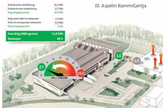
Ill: Aspelin Ramm/Gerilja

Og Wilhelmsen meiner det er stor likskap mellom varmepumper og solceller: enkle å installere, små bygningsmessige inngrep, ingen behov