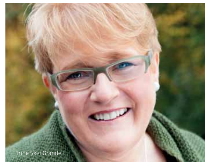
Trine Skei Grande.