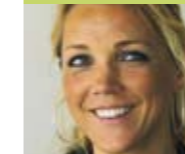
Tone Skråning Halden Venstre

Da jeg var liten, var Pisa et sted hvor man hadde gitt kompetansesvikt et sjarmerende monument i form av et tårn med solid slagside. Dette var før PISA-undersøkelsene – den internasjonale rankinglisten over ulike lands skolesystemer, hvor Norge har fått en lite flatterende plassering.