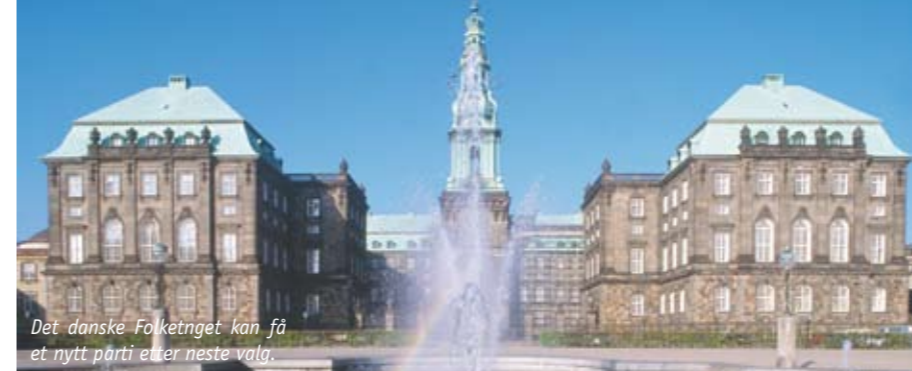
Det danske Folketinget kan få et nytt parti etter neste valg.