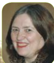
Sogn og Fjordane