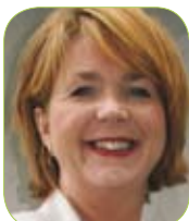
Møre og Romsdal