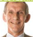
Gunvald Ludvigsen stortingsrepresentant, Venstre

Dei næraste åra kjem den delen av befolkninga som er mellom 55 og 66 år til å vakse kraftig. Det norske samfunnet treng arbeidskrafta frå seniorane for å sikre økonomisk vekst og auka velferd. Dette er ei utfordring som vi deler med de fleste landa i Europa. Det er difor viktig at vi greier å få fleire enn i dag til å ta del i arbeidslivet lenger. Stortinget diskuterte dette nyleg, etter at regjeringa la fram ei eiga «seniormelding».