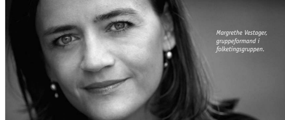
Margrethe Vestager, gruppeformand i folketingsgruppen.