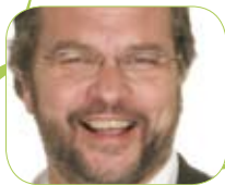
Lars Sponheim Partileder Medlem i Stortingets finanskomité