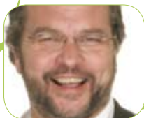
Lars Sponheim Partileiar Medlem i Stortingets finanskomité