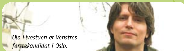
Ola Elvestuen er Venstres førstekandidat i Oslo.