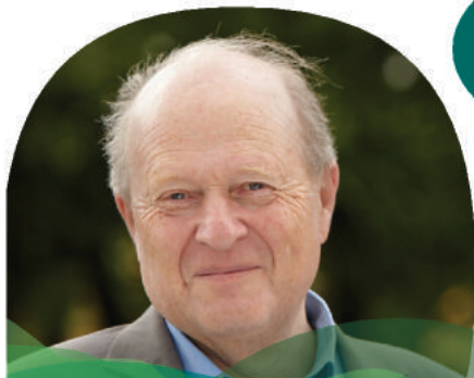
Odd Einar Dørum