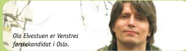
Ola Elvestuen er Venstres førstekandidat i Oslo.