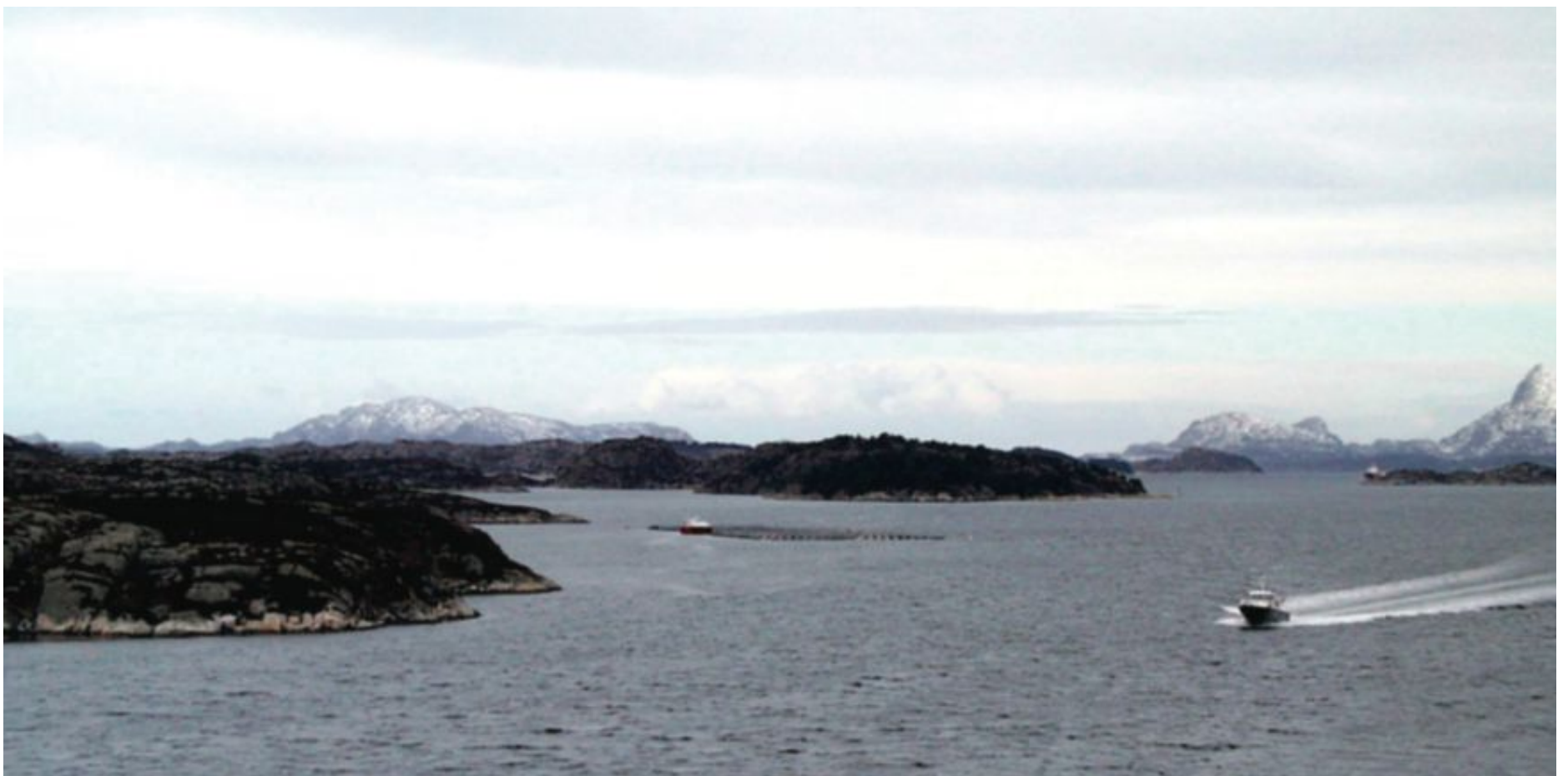
PLASS: Det er plass til både sjømatnæringen og sjødeponi i norske fjorder, mener Nordic Mining. ILL.FOTO