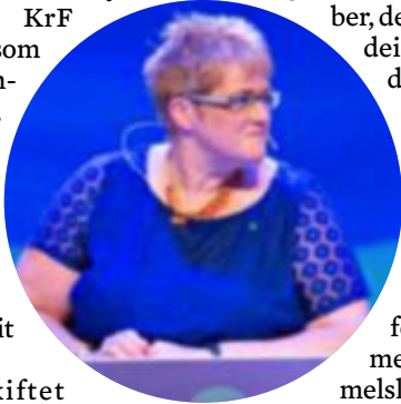
Utfordra: Trine Skei Grande (V).