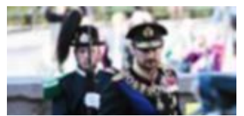
Får kritikk: Kronprins Haakon.

2: Folkeavstemning, så Norge kan bli republikk så fort vår nåværende konge trekker seg tilbake, om et par år. Best om bare de under 30 år får lov til å stemme.