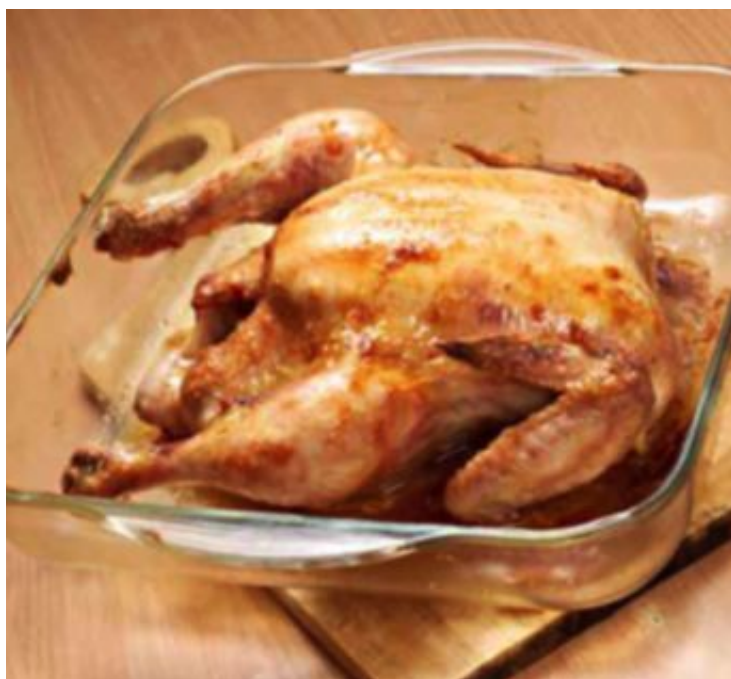
Problematiske: Venstre er inkonsekvente når partiet både vil ha dyrere kjøtt og går inn for økt kyllingkonsesjon, skriver leserbrevforfatteren.